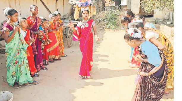
सुवा नृत्य करती युवतियां।

इन दिनों ग्रामीण क्षेत्रों में सुआ, शैला नृत्य की धूम मची है। खेती किसानों का काम समाप्त हो जाने पर ग्रामीण नई धान फसल की कटाई के उपलक्ष्य में हर्षोल्लास और सांस्कृतिक गर्व के साथ यह उत्सव मना रहे हैं। मनोरंजन के लिए एक दूसरे के गांव में टोली में पहुंच मनमोहक नृत्य प्रस्तुत करते हैं। परंपरासुर ग्रामीण गांव में पहुंचे टोली को धान, चावल एवं सथासंभव राशि देकर सम्मानित करते हैं। इस तरह के आयोजन से जिले के गांव में उत्साह का माहौल है।