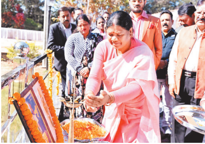
अटल परिसर लोकार्पण अवसर पर मौजूद अतिथि।