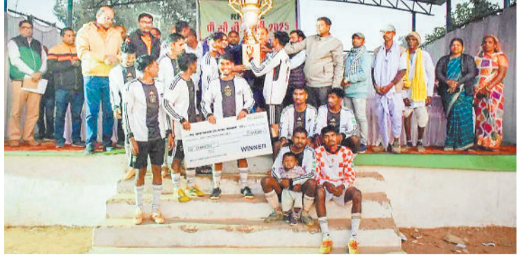
किया। विजेता साल्ही टीम को 61 हजार नकद राशि और पीसीबी ट्रॉफी प्रदान की गई, जबकि